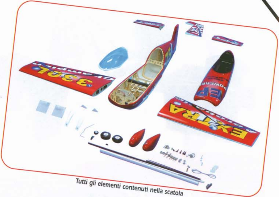
Tutti gli elementi contenuti nella scatola