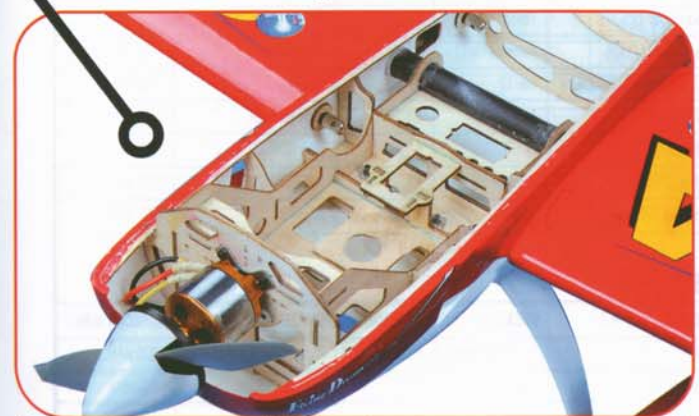
La parte superiore smontabile fino al muso consente un accesso totale all'interno, rendendo facilissimo il lavoro di installazione dei vari elementi.