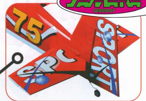
Le superfici mobili sono generose il che lascia presupporre buone capacità di volo 3D