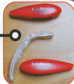
Il carrello fornito con le carenature delle ruote già decorate