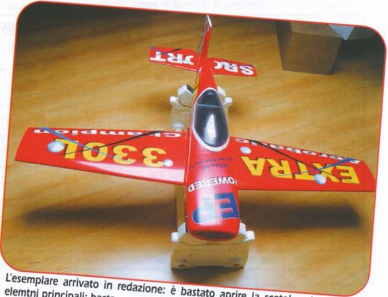
L'esemplare arrivato in redazione: è bastato aprire la scatola ed unire gli elementi principali: basta montare radio, comandi e motore per essere pronti.