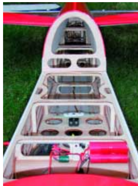
Tiefere Einblicke in soliden Leichtbau. Vorne 500-mAh-Empfängerakku und 1.200-µF/6,3 V-Stützkondensator, der kurzdrähtig mit einem freien Empfängeranschluss verbunden ist