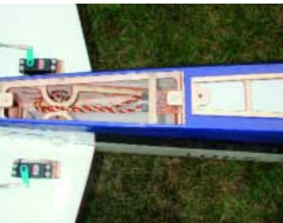
Guter Service: Die Klappe im hinteren Rumpfteil macht das Höhenrudder-Servokabel zugänglich. Unter der Platine (rechts) die Stützkondensatoren 2 x 1.200 F

etwa 230 Umdrehungen pro Volt (rpm/V) und 820 Gramm Kampfgewicht, der dem etwas leichteren, aber ansonsten durchaus leistungsverwandten AXI 5330/18 einfach deshalb vorzuziehen war, weil bei ihm das Wirkungsgradmaximum (etwa 88 Prozent bei U_{\text{mot}} = 30 \text{ V} ) im Bereich von 60 A liegt (statt nahe 30 A beim AXI). Man konnte also bei (Leistungs-)Bedarf noch ein wenig „in den Strom“ gehen. Der Außenläufermotor hat eine stabile 8-Millimeter-Welle. Leider ist vom Hersteller kein passender Mitnehmer lieferbar. Er musste maßgefertigt werden. Gewählt wurde die Einbaulösung, um später auch vielleicht mal auf einen Getriebemotor überwechseln zu können. Die Herstellerangabe, bei zehn LiPos noch einen 24-Zoll-Propeller zu erlauben, war allerdings schnell ins Reich der frommen Wünsche verbannt (Motorstrom über 100 A); doch ein 20 x 10 erschien realistisch. Als Stromspender, der schon mal 70 bis 80 A