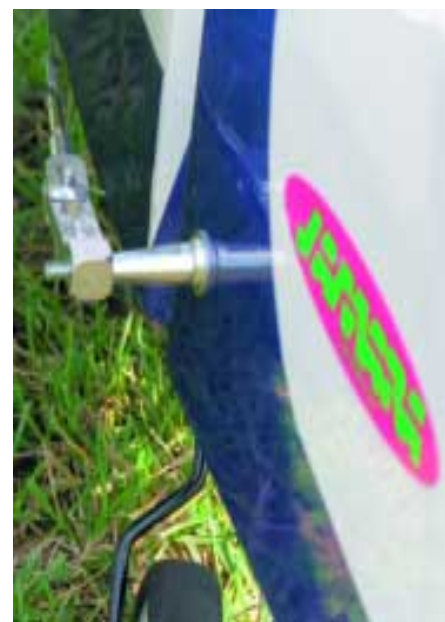
Achtung: Drehachse am Ruderkorn muss auf Höhe der Ruderdrehachse liegen, sonst funktioniert der Seilantrieb nicht!

pfeilten Flügel, bei dem die Flügelförderkanten in einer Linie verlaufen. Wer hier nur an der Flächenwurzel misst, liegt grob daneben. Vorsichtig gerechnet liegt der Schwerpunktansatz etwa an der Vorderkante des Flächensteckrohres und darf dann mit einsetzender Flugerprobung noch etwas zurückwandern. Wider Erwarten lies sich der Schwerpunkt trotz des (an Verbrennermaßstäben gemessen) leichten Motors problemlos durch Verschieben der etwa 1,25 Kilogramm schweren Antriebsbatterie einstellen. Der Akku ragt dabei halb in den bei abgenommener Kabine offen liegenden Bereich und ist somit leicht zu wechseln. Es zahlt sich eben aus, wenn ein