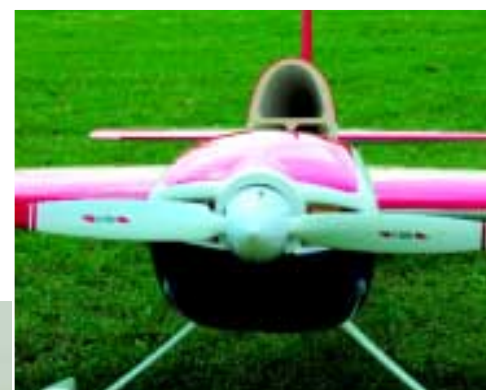
Hier ist noch zuviel Motorsturz eingestellt

pfeilten Flügel, bei dem die Flügelförderkanten in einer Linie verlaufen. Wer hier nur an der Flächenwurzel misst, liegt grob daneben. Vorsichtig gerechnet liegt der Schwerpunktansatz etwa an der Vorderkante des Flächensteckrohres und darf dann mit einsetzender Flugerprobung noch etwas zurückwandern. Wider Erwarten lies sich der Schwerpunkt trotz des (an Verbrennermaßstäben gemessen) leichten Motors problemlos durch Verschieben der etwa 1,25 Kilogramm schweren Antriebsbatterie einstellen. Der Akku ragt dabei halb in den bei abgenommener Kabine offen liegenden Bereich und ist somit leicht zu wechseln. Es zahlt sich eben aus, wenn ein