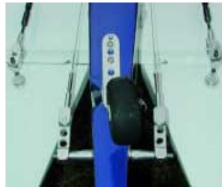
Bei der Ruderanlenkung ist etwas viel Material verbaut. Man braucht es wohl, wenn stirnseitig ein fast 2 Kilogramm schwerer Baumsägentreibling werkelt

Ansonsten war dieses „Einlaufen“ ein voller Erfolg. Das Amperemeter bestätigte mit etwa