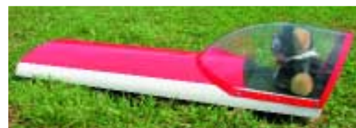
Eine lange abnehmbare Haube macht das Rumpfvorderteil gut zugänglich. Die Klarsichthaube ist übrigens schon passgenau zugeschnitten

Schon beim Erststart zeigt sich: Die große Edge geht ab wie ein böses Tier! In alle drei Dimensionen. Es ist genügend Leistungsüberschuss vorhanden. Noch fliegt die Maschine nicht vollkommen