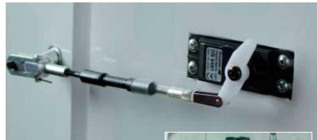
Das Querruder-Servo mit stabiler Ruderanlenkung

Grundsätzlich ist es nämlich wichtiger, hier auf niedrigen Innenwiderstand als auf ausufernde Kapazitätsreserven zu achten. Pro Flug werden übrigens ganze 150 bis 200 Milliamperestunden (mAh) verbraucht, mithin also nur ein Drittel der Nennkapazität. Was also spricht dagegen, so einen Akku vor jedem Flug zu laden und alle paar